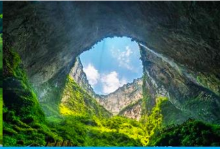
อุทยานหลุมฟ้า