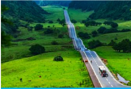
อุทยานเขานางฟ้า

พักที่ MOUNTAIN VIEW HTL // DAWEIYING HTL โรงแรมระดับ 4 ดาวหรือเทียบเท่าในเมืองอู่หลง