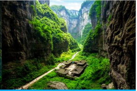
สะพานธรรมชาติสามแห่ง