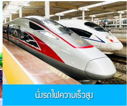
บริการไฟความเร็วสูง

วันที่หก นครฉงชิ่ง-เมืองโบราณฉือชิว-รถไฟความเร็วสูงสู่เมืองหยีชาง-อิสระช้อปปิ้งย่านการค้า