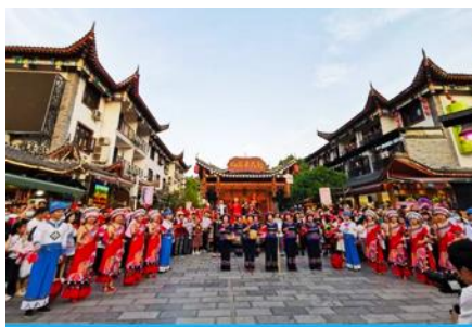
เมืองเทพริดา