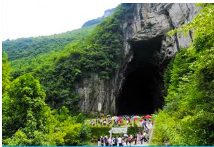
ถ้ำพญามังกร

พักที่ VIENNA HOTEL โรงแรมระดับ 4 ดาวหรือเทียบเท่าในเมืองเินซือ