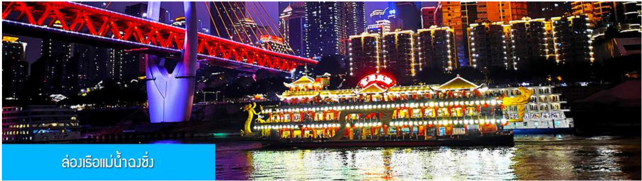
ล่องเรือแม่น้ำฉงชิ่ง

พักที่ HAITANGLIZHI HOTEL โรงแรมระดับ 4 ดาวหรือเทียบเท่าในเมืองฉงชิ่ง