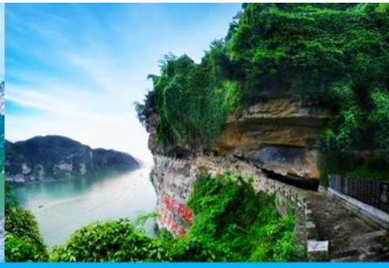
สวนถ้ำสามสหาย